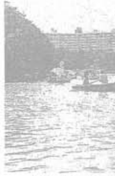
貸しポートに...の頭池などは...族連れに根強い

方針だ。同公園は井の頭池周...御殿山、西園、第2公園に分かれている。拡...張部分は西園に隣接して